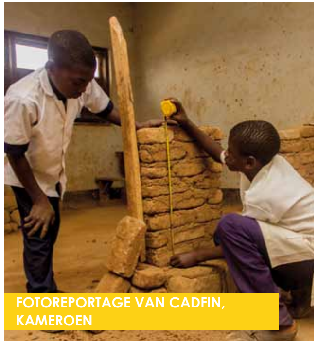
FOTOREPORTAGE VAN CADFIN, KAMEROEN

Shitoli Youth Polytechnic en Gered Gereedschap danken u voor uw hulp!