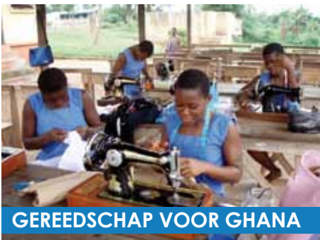
GEREEDSCHAP VOOR GHANA

Eind februari ging de container met bestemming Ghana op transport. Aan boord een grote hoeveelheid opgeknapt gereedschap voor een 10-tal projecten gericht op het vergroten van de kansen van jongeren, gehandicapten en kansarmen.