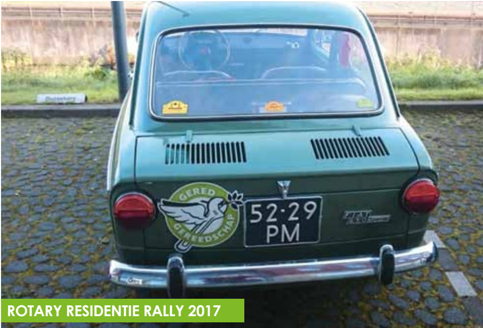
ROTARY RESIDENTIE RALLY 2017

Sinds 2014 organiseert de Rotary Club 's Gravenhage Residentie voor haar leden en belangstellenden een zogenaamde Klassieker Rally. Daarbij gaat het niet om snelheid en motorgeronk, maar om een flinke rondrit van zo'n 100 kilometer met puzzelopdrachten en fijne verzorging onderweg. Deelnemen kan met iedere auto, het is natuurlijk een geweldige mogelijkheid om een klassieke (sport-) auto eens 'uit te laten'.